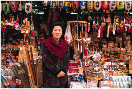
Das an die Kunden angepasste Sortiment, die Dienstleistungen und der Preis entscheiden über den Erfolg dieses Ladens in China.